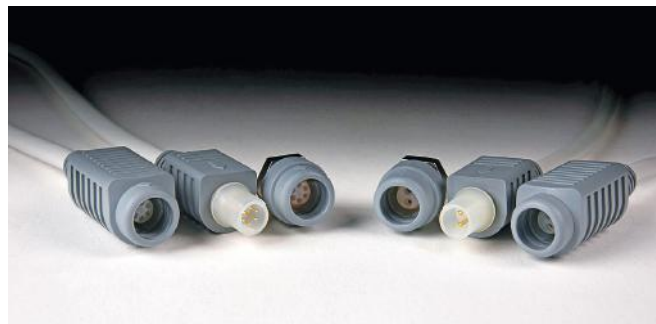
Рис.5. Разъемы серии ODU MINI-MED

В отличие от разъемов ODU MINI-SNAP соединители семейства ODU AMC требуют заделки места