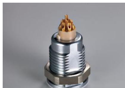
Рис.2. Контактная группа разъема ODU MINI-SNAP с контактами под пайку проводом

Во всех перечисленных примерах кабельные сборки ODU MINI-MED выполнены по технологии литья