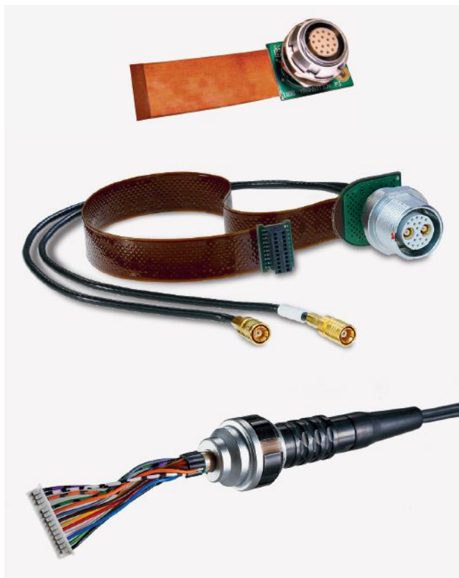
Рис.3. Примеры сборок с разъемами ODU MINI-SNAP®

под давлением (overmolding) , именно эта технология в основном используется при заделке кабельных разъемов ODU AMC.