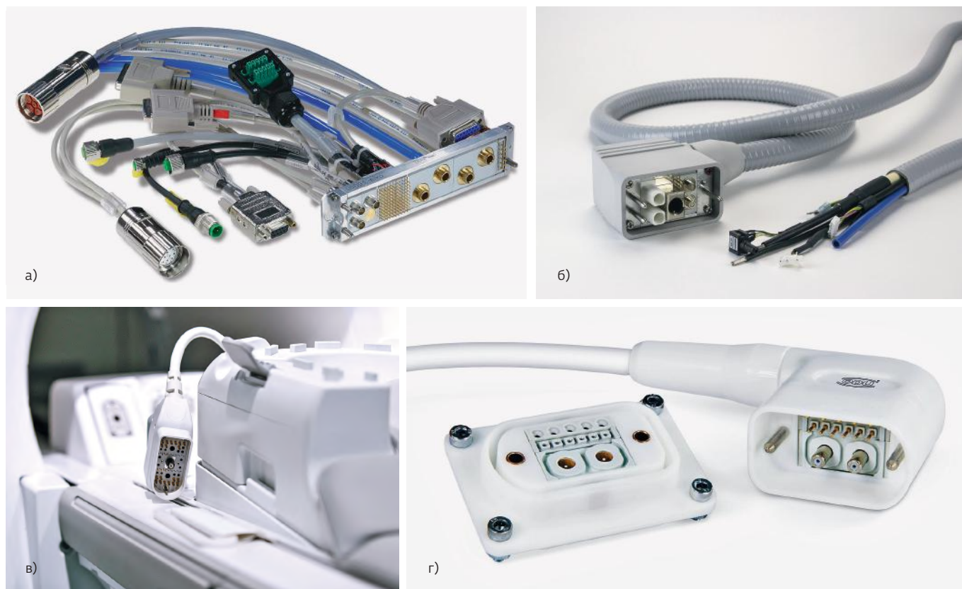
Рис.1. Примеры кабельных сборок с модульными разъемами: а) ODU MAC® Silver-Line; б) ODU MAC® White-Line; в) заказное решение ODU MAC® для MPT; г) ODU MAC® ZERO

Удобство монтажа обеспечивается тем, что контакты под пайку проводом расположены вдоль концентрических окружностей и сформованы конусом (контакты в центре длиннее крайних контактов, рис.2), а контакты для пайки на плату имеют одинаковую длину. Все это значительно упрощает монтаж. Точно также устроены контактные группы цилиндрических разъемов серий ODU MEDI-SNAP, ODU MINI-SNAP PC, ODU AMC и ODU AMC High-Density.