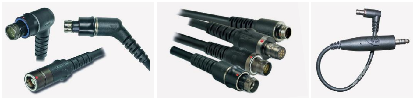
Рис.6. Примеры кабельных сборок ODU AMC, выполненных методом литья под давлением

Наконец, можно заказать как кабельную сборку, так и монтаж на плату в соответствии с техническим заданием (ТЗ) заказчика. При этом следует иметь в виду, что заказ розеток с монтажом на плату со шлейфом подразумевает некоторые инвестиции со стороны компании ODU, поэтому данный вариант экономически целесообразен только в условиях серийного производства. Примеры таких сборок приведены на рис.7.