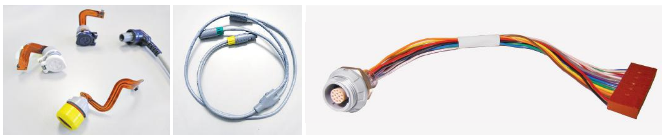
Рис.4. Примеры сборок с разъемами ODU MEDI-SNAP®